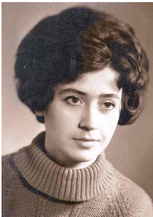
Студентські роки. 1967 р.